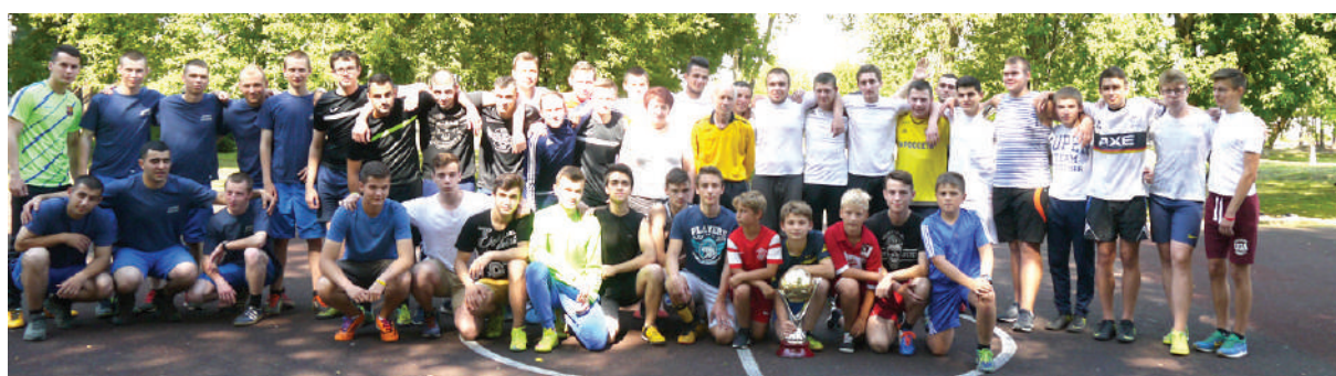
Сражались в футбол за кубок главы