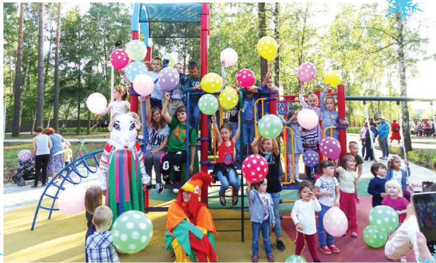
Открывали парк на ул. Рябиновой