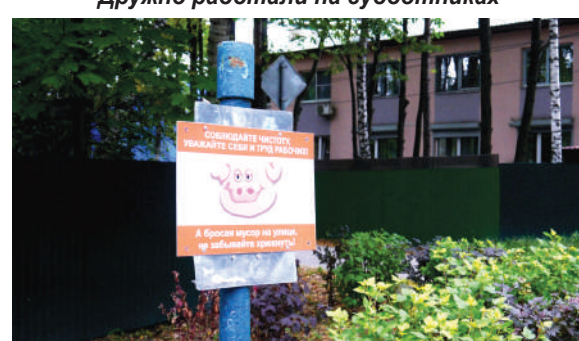
Боролись за чистоту в поселении