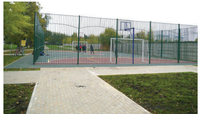
Открывали новые спортплощадки