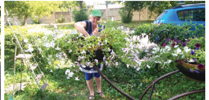
Украшали наше поселение