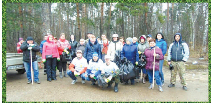
Убирали лес рядом с железной дорогой