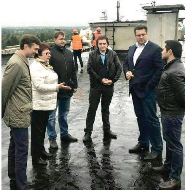
Боролись за качество капитального ремонта

В сельском поселении Тарасовское большое внимание уделяется созданию комфортной и благоприятной среды проживания. С каждым годом результаты этой работы становятся все заметнее. Давайте вспомним, как мы прожили уходящий год, что сделали и какую лепту внесли в развитие нашего поселения