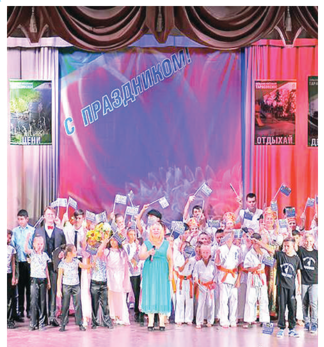
Отмечали праздники массовыми мероприятиями