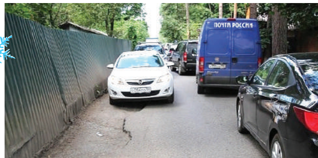
Боролись за свою улицу. Так было на ул. Солнечной до перекрытия проезда