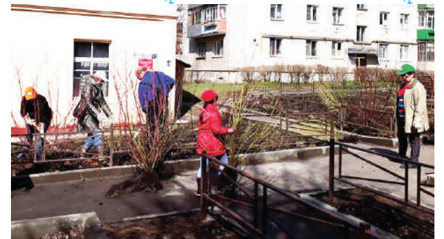
Высаживали Лес Победы