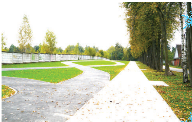
Продолжили обустройство пешеходной зоны в пос. Челюскинский