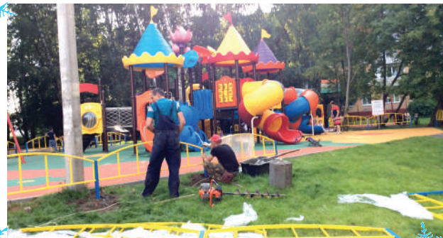
Устанавливали новые игровые комплексы и обустроивали детские площадки