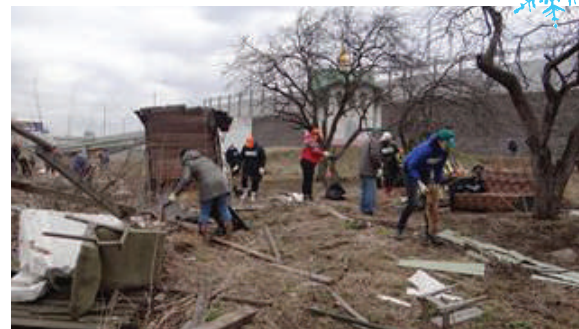
Дружно работали на субботниках