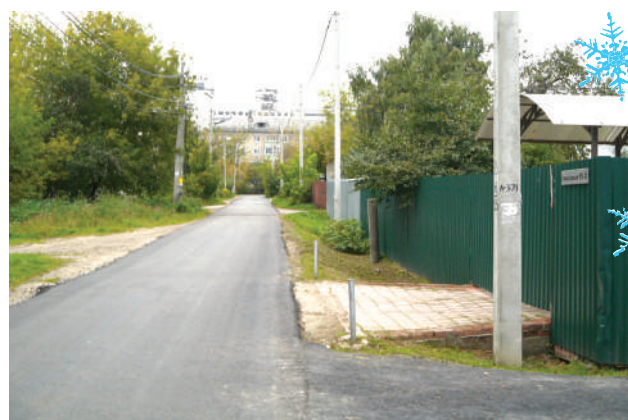
Строили новые дороги