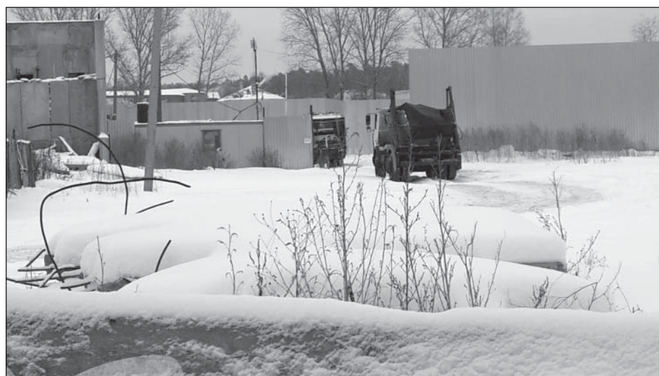
Январь 2015. На закрытую территорию спешат груженные мусором машины, одна за одной.....

УВАЖАЕМЫЕ ЖИТЕЛИ! АДМИНИСТРАЦИЯ СЕЛЬСКОГО ПОСЕЛЕНИЯ ТАРАСОВСКОЕ ДОВОДИТ ДО ВАШЕГО СВЕДЕНИЯ ГРАФИК ВСТРЕЧ руководства филиала ГУП МО «Мособлгаз» «Мытищимежрайгаз» и Королевской РЭС с жителями поселка Лесные Поляны на 2015 год