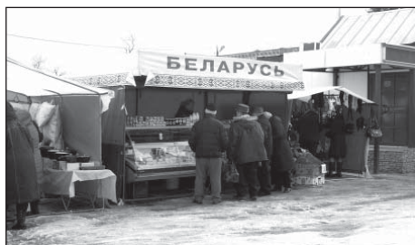
Продукция Белоруссии пользуется спросом у покупателей.

Как показали ярмарочные дни января - это необходимое событие в современном экономическом пространстве, проводимое с целью обеспечения жителей доступной, качественной и разнообразной