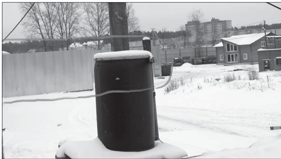
Еще один забор - чтоб подстраховаться от нерадивости рабочих...

В настоящее время к решению вопроса вновь подключилась городская про-куратура Пушкинского муниципального района, куда обратилась администра-ция поселения с просьбой о помощи в наведении порядка.