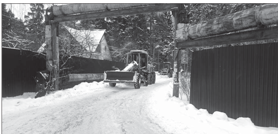
Создание собственного предприятия коммунальных услуг в с.п. Тарасовское, где работают всего 10 рабочих, полностью обеспечило чистые дороги и тротуары в праздничную декаду