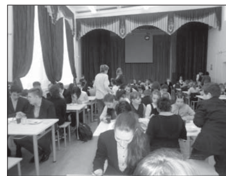
В школьной столовой всегда многолюдно

С декабря 2014 года фасад школы засверкал новыми пластиковыми окнами на втором этаже. В начальных классах стало светло и уютно. Осенью поменяли мебель в столовой. Теперь здесь новые белые столы и удобные скамейки. А кухня полностью укомплектована современной