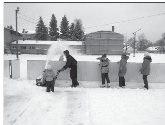
Первые посетители катка очень довольны

В рамках масленичных развлечений 18 февраля на катке запланирована спортивно-развлекательная программа «Масленичные потехи».