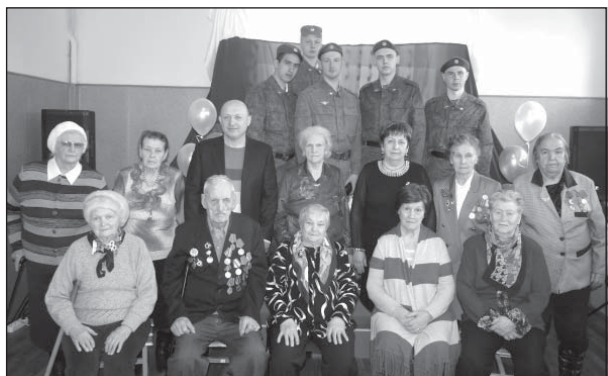
Ветераны передали эстафету славы молодым бойцам

УВАЖАЕМЫЕ ЖИТЕЛИ СЕЛЬСКОГО ПОСЕЛЕНИЯ ТАРАСОВСКОЕ! По многочисленным просьбам наших односельчан мы перенесли время начала праздничных мероприятий, посвященных 9 Мая, на более позднее время (смотрите афишу). Многие жители нашего поселения очень хотят посмотреть Парад Победы на Красной Площади по телевизору, и в то же время не пропустить праздничные мероприятия в нашем поселении. Идя навстречу их пожеланиям, Администрация с.п. Тарасовское сдвинула время начала митингов.