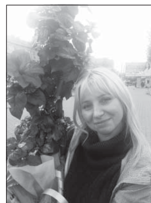
Коллектив ДК «Импульс»