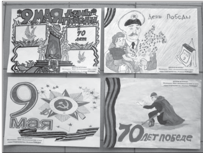
Открытки для ветеранов