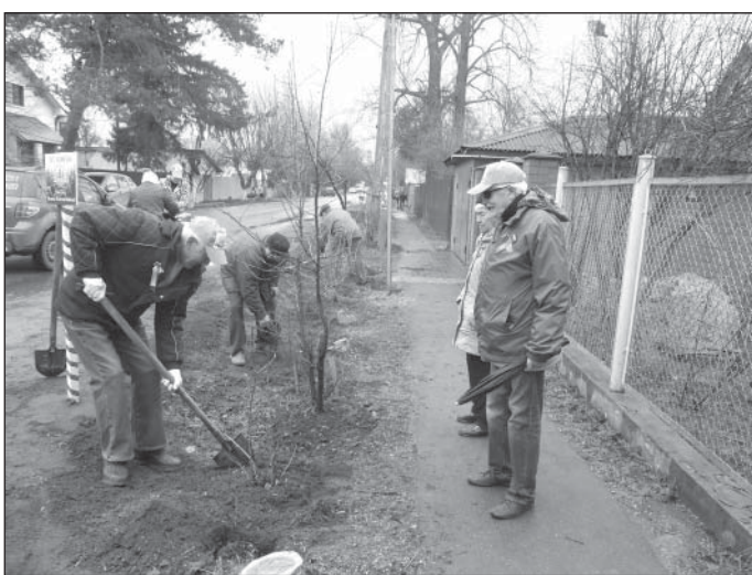
Сирень и рябина украсят целую улицу

Областная экологическая акция «Лес Победы», посвященная 70-й годовщине Победы в Великой Отечественной войне, прошла во всех