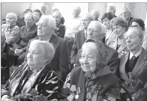
Ветераны - наша гордость и слава