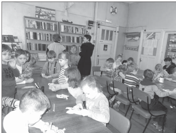
Мастер-класс по изготовлению маски

Ребята посмотрели фильм-презентацию «Покорителям космоса посвящается», познакомились с книгами о космосе и космонавтах, а затем участвовали в познавательной викторине «Мы к звездам проложим путь» и мастер-классе по изготовлению маски инопланетянина.