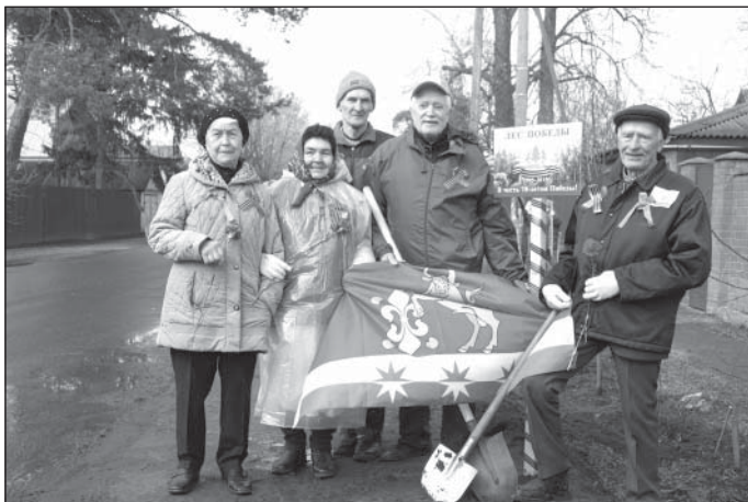
Ветераны села Тарасовское к участию в акции «Лес Победы» готовы!

муниципалитетах Московской области. Всего жители региона посадили 1 миллион деревьев – по числу людей, погибших в битве за Москву. Акции «Лес Победы» поддержали во всех регионах