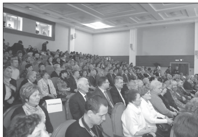
В день открытия «Современника» в зале был аншлаг

«К этому дню мы шли очень долго. В 2002 году стоял вопрос о продаже Дома культуры (до 2002 года это ведомственное здание принадлежало ОАО «Болшево-Хлебопродукт»). Мы обратились в районную администрацию