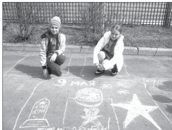
В рамках подготовки к празднику День Победы ученики 2А и 4 классов провели конкурс рисунка на асфальте «Мы помним»