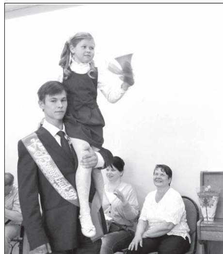
Звонит, звонит звонок последний...