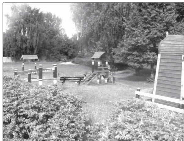
Детская площадка на ул. Колхозный Тупик

Детские площадки: покраска форм, отремонтированы и выполнены сварочные работы на всех площадках, завозится песок. Приобретены новые формы: Мичуринский Тупик (малый игровой комплекс, лавочки урны); ул. Ленина, 6 (новая песочница, отвечающая санитарным требованиям, качели и горка). Для размещения во дворах в пос. Лесные Поляны приобретены ещё 4 новых песочницы. Уложено новое каучуковое покрытие на детской площадке на ул. Ленина, 8.