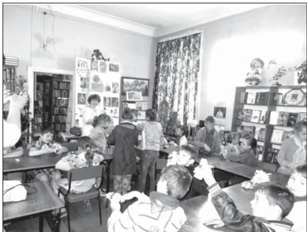
Мастер-класс проводят сотрудники библиотеки

В экспозиции представлены традиционные славянские маски, оружие, глиняная и деревянная посуда, предметы рукоделия, подготовлена выставка книг “В мире русского языка”. «Программа включает интерактивное знакомство с русскими фольклорными героями; обучение русским народным играм