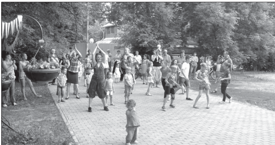
Джинсовая дискотека собрала молодежь всех возрастов

Сколько же бардовских песен было там спето, сколько прозвучало композиций авторского сочинения! Такие встречи