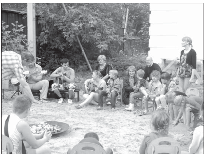
Песни у костра любят все поколения

К сожалению, долгие ливни помешали провести одно из самых массовых мероприятий – «Велосамокатопробег». Организаторы перенесли его на праздник Ивана Купалы, который состоится 7 июля в 17.00 в с. Тарасовка (Колхозный тупик, детская площадка). Приходите, не пожалеете!