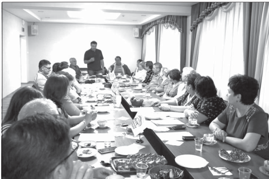
Обмен опытом решения насущных вопросов

Во время диалога, безусловно, возникли спорные моменты, но в конструктивной беседе были найдены компромиссные решения.