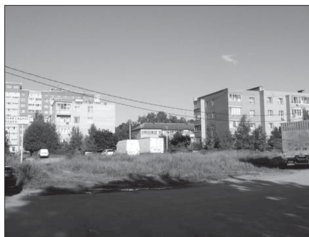
Территория для комплексного благоустройства, ул. Центральная, 10