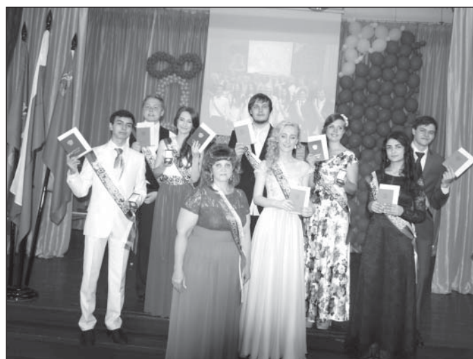
Звездный выпускной Челюскинской СОШ