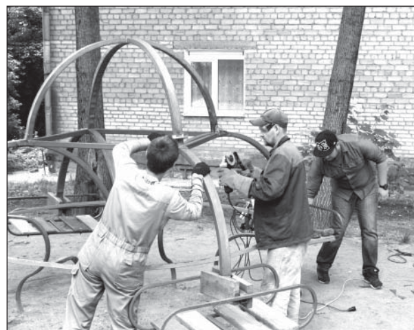
Ремонт на детской площадке, Б.Тарасовская, 108

Окосы, санитарная обрезка зеленых насаждений: ул. Ленина, 6, Садовая, 25, Мичуринский тупик.