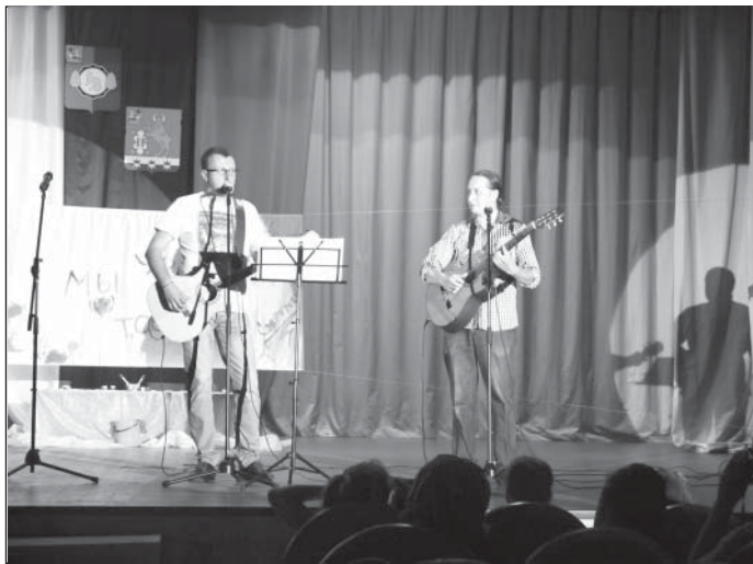
На сцене - группа "Ремарка"

Проливные дожди внесли коррективы в сценарий праздника, его пришлось перенести в помещение. Он начался со встречи за “круглым столом” в ДК «Современник». Участники его, а это оказались, в основном, девушки, выразили готовность стать активными помощниками в продвижении молодежных программ развития в сельском поселении Тарасовское. Это вопросы отдыха и занятости, а также комфортного проживания в поселении – чистота дворов и улиц, обустройство рекреационных зон, работа досуговых центров.