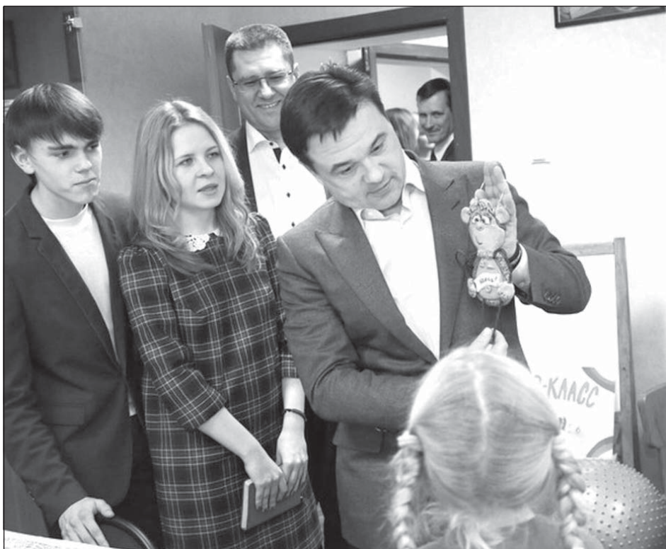
Ребята из студии “Дар” подарили губернатору сделанную своими руками веселую обезьянку - символ приближающегося Нового года

Общие затраты на реконструкцию составили около 75 млн. рублей. В результате были отремонтированы внутренние помещения и фасад здания, закуплены мебель, шторы, оборудование, инвентарь, а также благоустроена прилегающая территория.