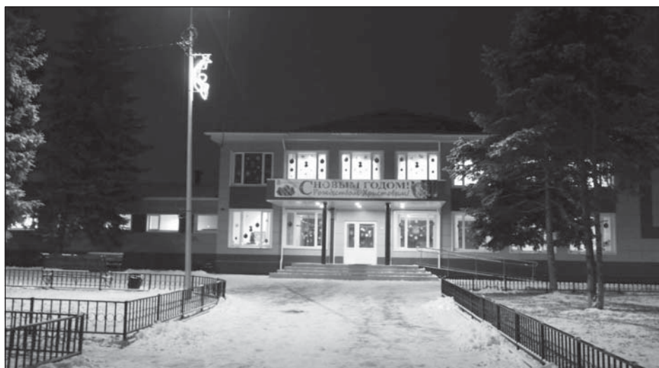
Дом культуры - центр притяжения в праздничные дни