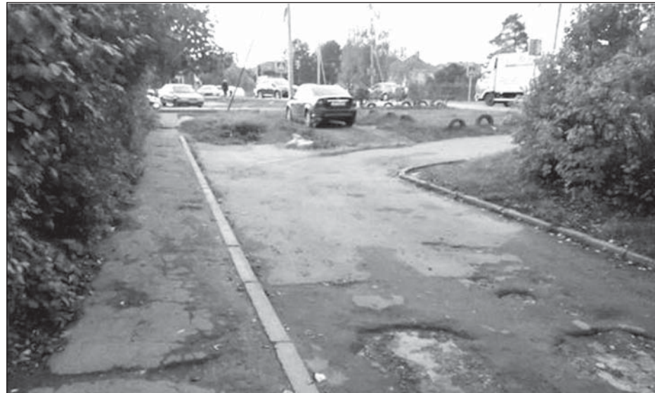
Дворовая территория дома 10 по улице Центральная до...

Кроме того, на этой придомовой территории значительно расширены тротуары вдоль дома, оборудованы парковочная зона и проходы к детской площадке. Входные группы в подъезды выложены тротуарной плиткой. Вдоль зеленой зоны со стороны ул. Центральная появился новый тротуар, заасфальтирована площадка, на которой в следующем году будут установлены новые игровые формы для детей и ограждение. Зеленая зона также приведена в порядок.