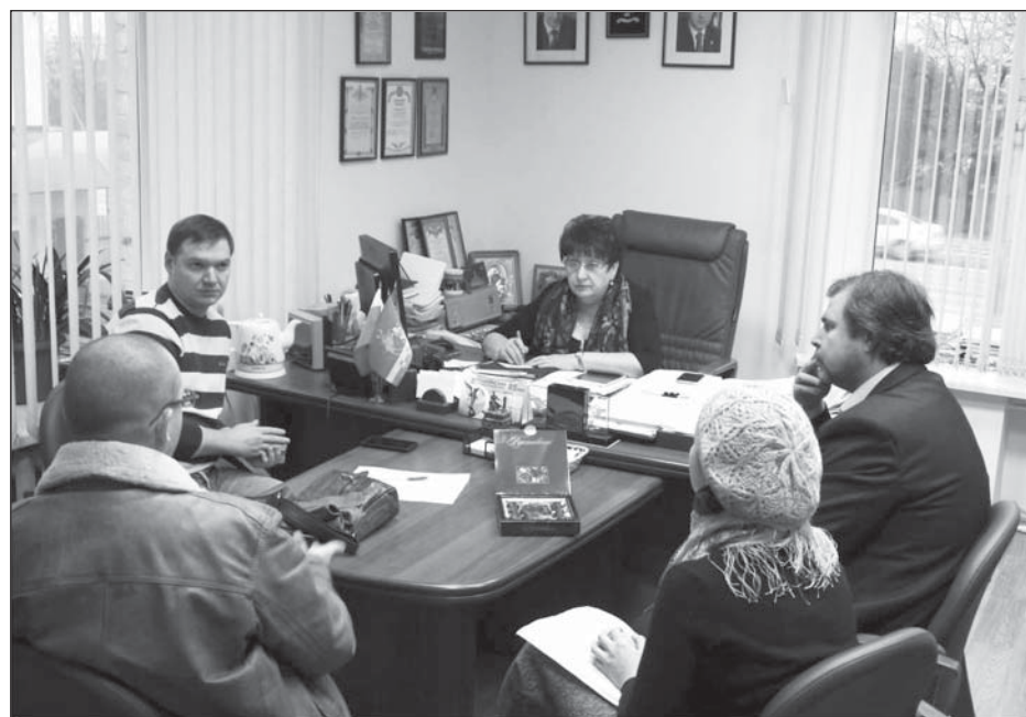
Встреча с жителями ул. Солнечная

Как правило, на таких совместных встречах находятся пути решения противоречий, конфликтов, снятия напряженности. Если же не удастся это сделать, к сожалению, остается лишь один путь - судебное разбирательство спорящих сторон, которое требует времени, средств и больших моральных затрат.