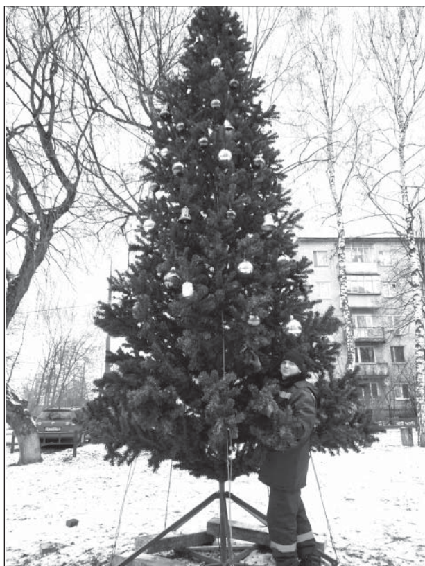
Сотрудники МБУ РЭУ готовят поселение к Новому году

Для новогодне-рождественского убора нашему поселению пока не хватает только снега. Будем надеяться, что к празднику он всё же укроет землю пушистым ковром, и зимние каникулы начнутся с зимних забав.