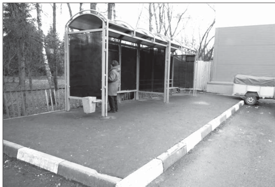
В Лесных Полянах на автобусной остановке установлен остановочный павильон