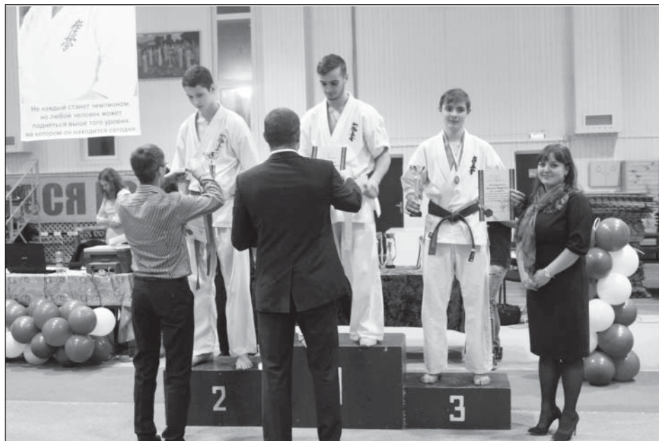
Награждение наших спортсменов в Липецке

Поздравляем ребят с заслуженными успехами и желаем дальнейших побед!