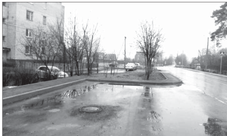
... и после ремонта

В 2014 г. жители ул. Радужная с. Тарасовка обратились к главе поселения с предложением выполнить совместные действия для того, чтобы на улице появилась дорога с асфальтовым покрытием. Своими силами в 2014 г. они сделали основание дороги в асфальтовой крошке. В свою очередь, администрация поселения в ноябре выполнила обещанную часть работ, уложив асфальт на площади 1100 кв. м.