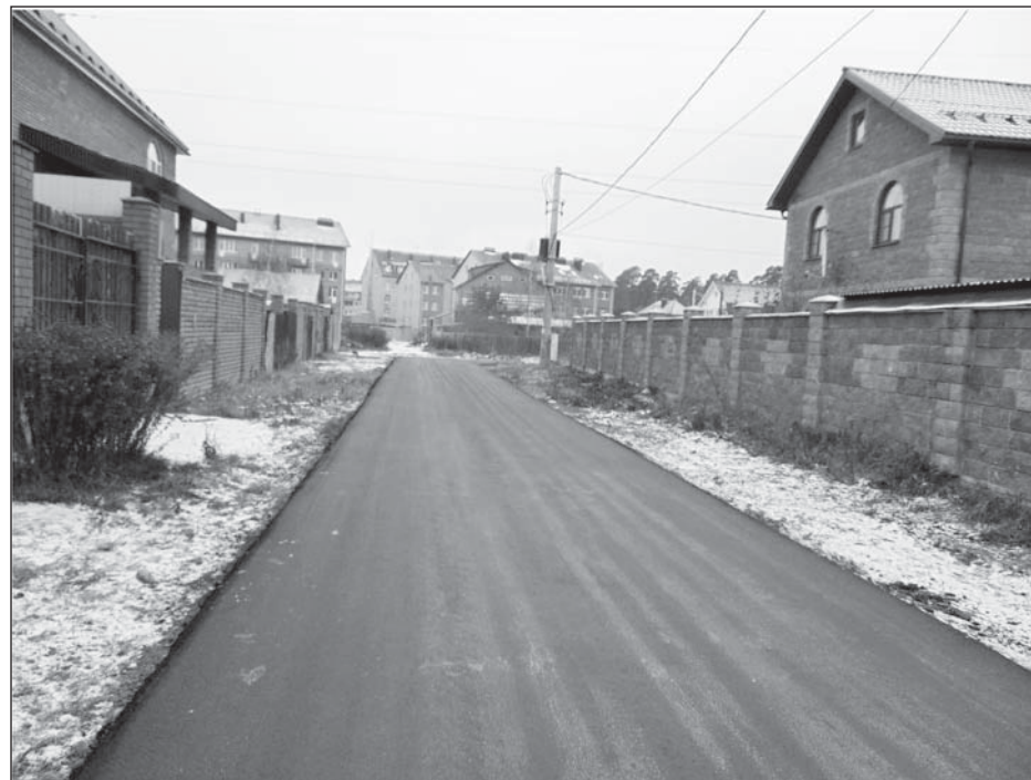
Дорога на улице Радужная

Какой стала дорога - видно на снимке. Жители ул. Радужная, вложив собственные усилия, теперь с удовольствием пользуются новой дорогой.