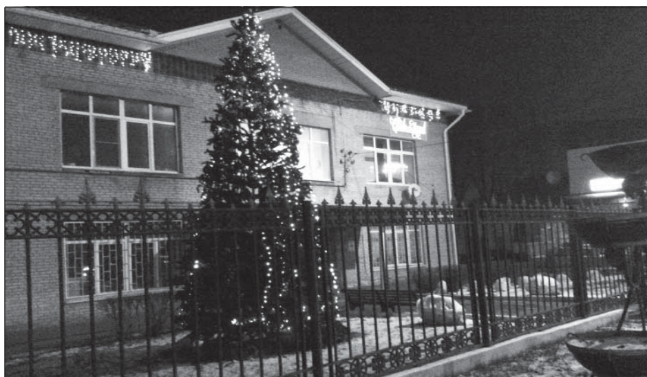
Новогоднее оформление здания администрации поселения