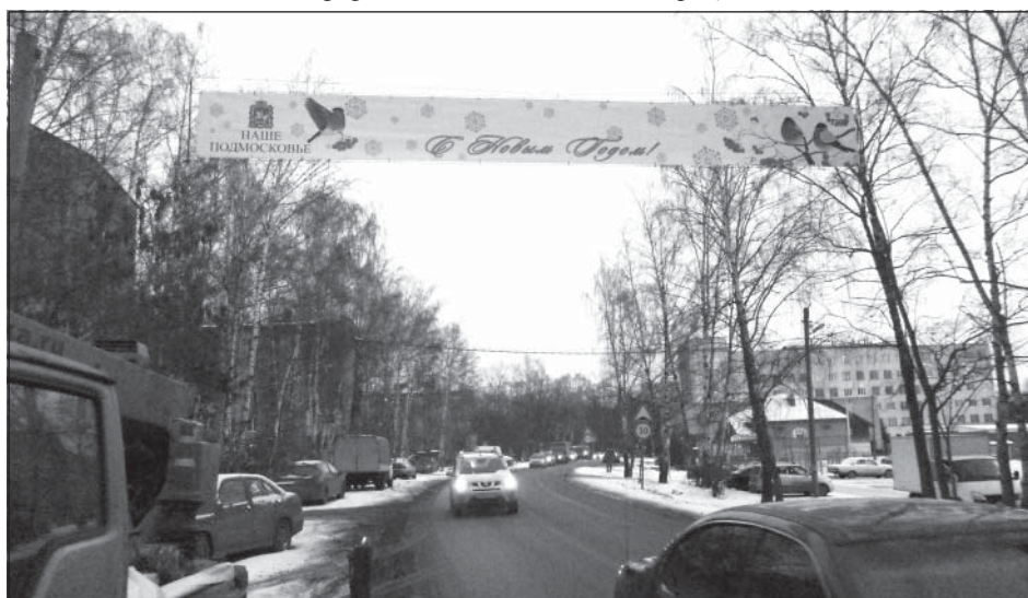
Улицы украсили праздничные растяжки