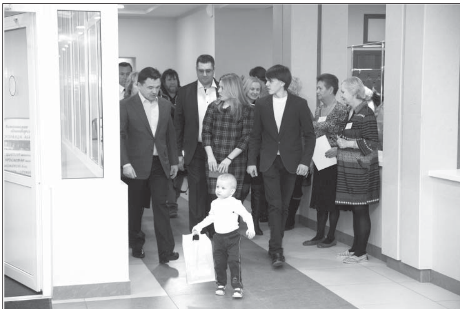
“Я тоже пришел заниматься в любимом кружке...” (Андрей Воробьев знакомится с восстановленным Домом культуры “Современник”)

В пос. Лесные Поляны Андрей Воробьев осмотрел Дом культуры “Современник”, который был реконструирован по губернаторской программе и стал любимым местом досуга жителей Лесных Полян. Здесь Андрей Юрьевич пообщался с родителями и ребятами, которые занимаются в клубных формированиях и кружках, а также с их руководителями.