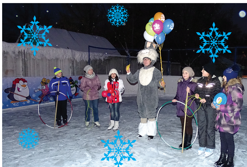
Каток у ДК «Современник»

А в пос. Челюскинском каток у ДК «Импульс» пока только в стадии заливки: здесь нет твердого основания для удержания воды, поэтому технология формирования ледяного покрытия более долгая. Но еще немного, и лед для будущих конькобежцев будет готов.