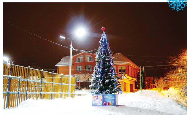
Колхозный тупик с. Тарасовка