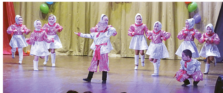
Танец «Валенки» в исполнении воспитанников ДК «Импульс»

Организаторы фестиваля-конкурса хорошо и продумано подошли к программе выступлений. Очередность