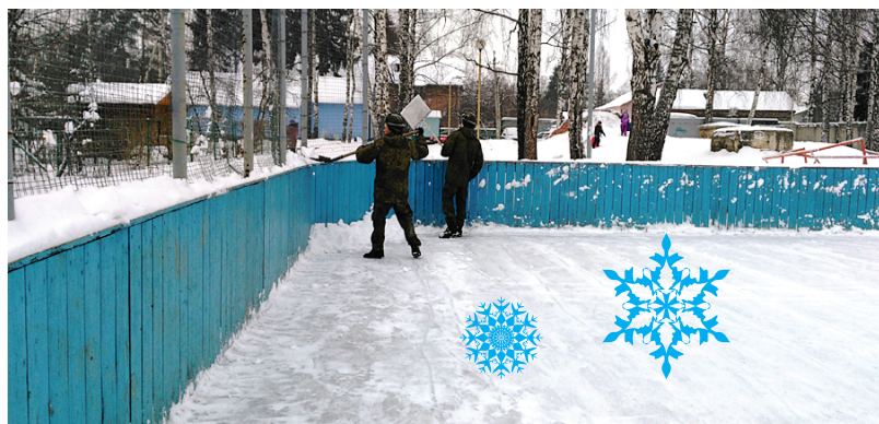
Каток на ул. Пожидаева залит силами управляющей компании и Батальона тропосферной и радиорелейной связи