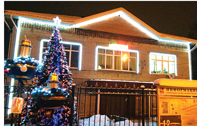
Обновленное оформление здания Администрации поселения

Приближение его чувствуется буквально во всем: и в ярком убранстве, сияющем радостными огнями гирлянд и светодиодных украшений, и в расклеенных повсюду афишах, сообщающих жителям о предстоящих новогодних мероприятиях в наших поселках, и в том, что на улицах установлены нарядные ели в ожидании веселых театрализованных представлений для детворы... Всего их в поселении семь.