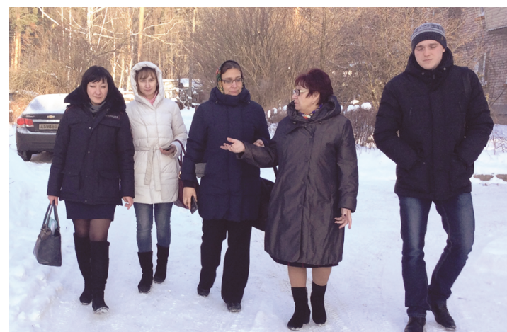
Если родители забывают свои обязанности, их им напомнят члены комиссии по делам несовершеннолетних

В начале декабря представительная комиссия посетила две таких семьи в пос. Лесные Поляны, поскольку от их соседей поступили жалобы на неоднократные нарушения социальных норм проживания в различные инстанции.