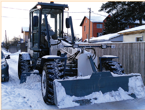
Теперь междворовые проезды, улицы и проулки чистит грейдер

Второй год в поселении работает МКУ «РЭУ Тарасовское», в задачи которого входит содержание внутриворонных проездов, улочек и переулков в нашем поселении, а также содержание детских и спортивных площадок, колодцев, уличного освещения, зеленых насаждений, ремонт тротуаров, подбор мусора и т.д.