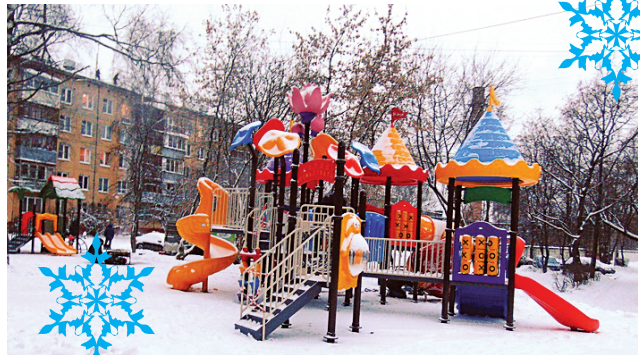
Новые игровые комплексы на ул. Ленина, 1-7 в пос. Лесные Поляны

В канун новогодних праздников преобразилась внутриворонная территория домов 1, 3, 4 и 7 по ул. Ленина в пос. Лесные Поляны. В соответствии с установленными стандартами, здесь начали реализовываться мероприятия по комплексному благоустройству. В условиях контракта было указано требование к подрядчикам завершить запланированные работы до начала детских новогодних каникул. И это им удалось.